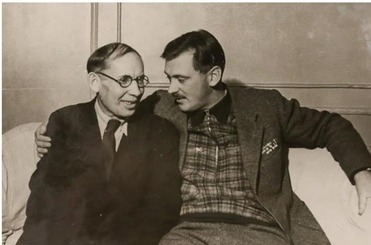
Сергей Михалков и Александр Волков на Неделе детской книги. 29 октября 1945 год

Только один раз, в победный 1945 год, праздник детской книги состоялся осенью в предпраздничные октябрьские дни.