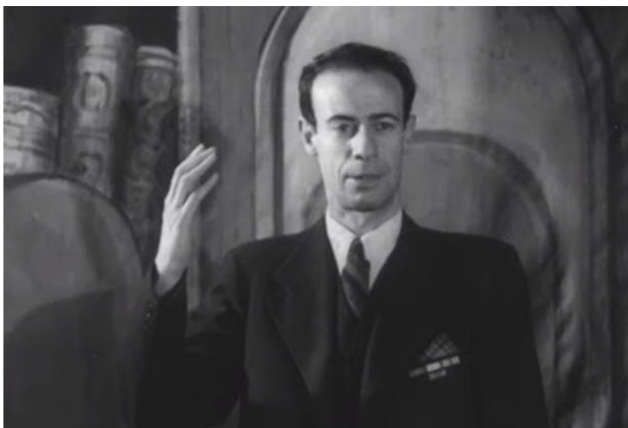
Лев Кассиль, 1947 год

Праздник широко шагал по стране. Торжество в Колонном зале запускало череду встреч с писателями, выставок детских книг, обсуждений прочитанного, которые проходили во Дворцах пионеров, библиотеках, школах. В 1949 году в празднике детской книги участвовали уже 23 города - Москва, Ленинград, Сталинград, Севастополь, Свердловск, Горький, Иваново и другие. В эти города для поддержки проведения Недели детской книги отправлялись 200 000 экземпляров детских книг, вышедших в 1948 и 1949 годах (Пионерская правда, 1949 год, №14).