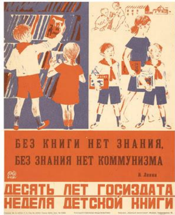
Десять лет Госиздата. Неделя детской книги, 1929 год

«9 мая Госиздат (Государственное издательство) празднует десятилетие своего рождения. Госиздат — самая большая в мире фабрика по социалистической обработке человеческих мозгов. Лучшие наши подарки Госиздату: 1. Пионеры-книгоноши. 2. Пополнение библиотек. 3. Борьба с плохой книгой. 4. Группы коллективного чтения книг».