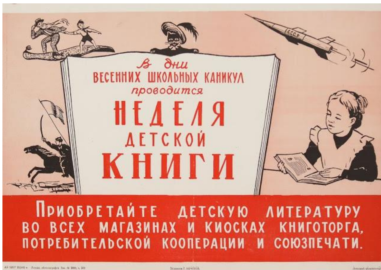
Плакат «Неделя детской книги», 1962 год

Юрий Яковлев, Разговор о Неделе, журнал «Детская литература», 1967 год, №1.