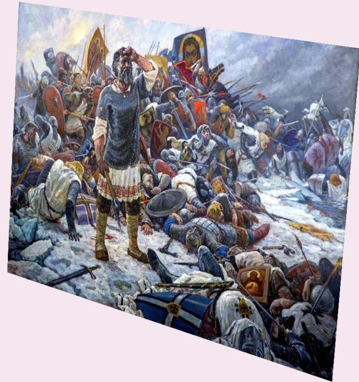
Ледовое побоище 1242 год