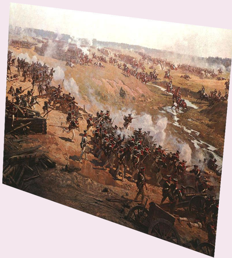
Бородинское сражение 1812год